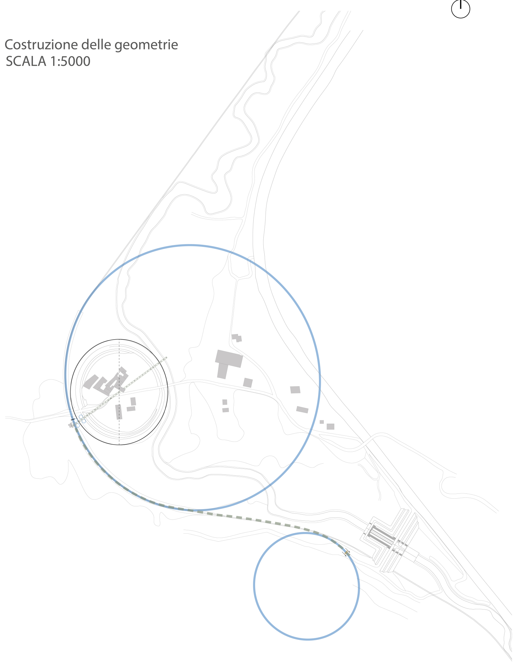
Costruzione delle geometrie SCALA 1:5000