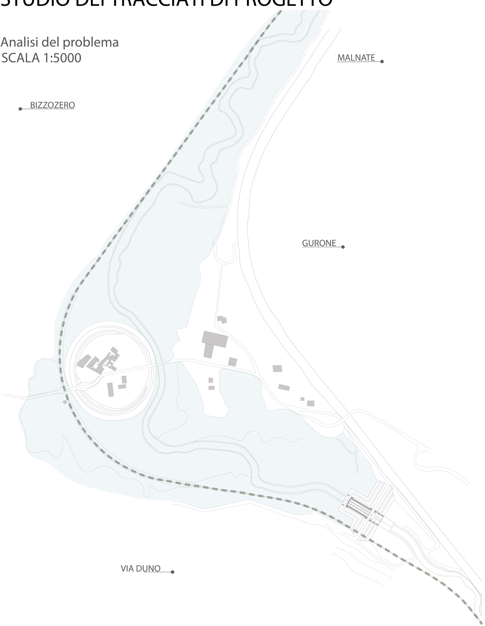
Analisi del problema SCALA 1:5000